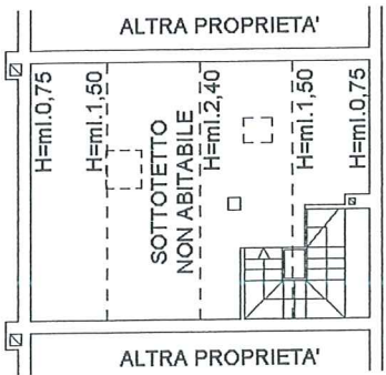
PIANTA PIANO SECONDO (SOTTOTETTO)