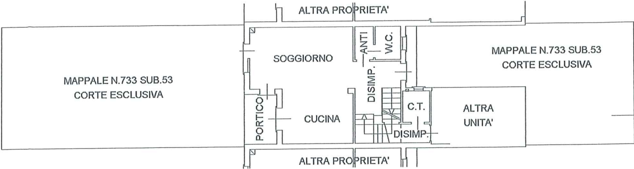
PIANTA PIANO TERRA H=ml.2,70