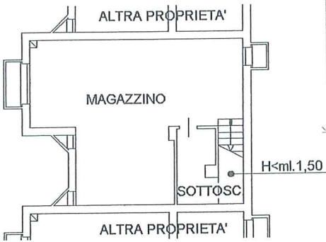
PIANTA PIANO PRIMO SOTTOSTRADA H=ml.2,40